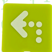
Drehung links und rechts um 90°